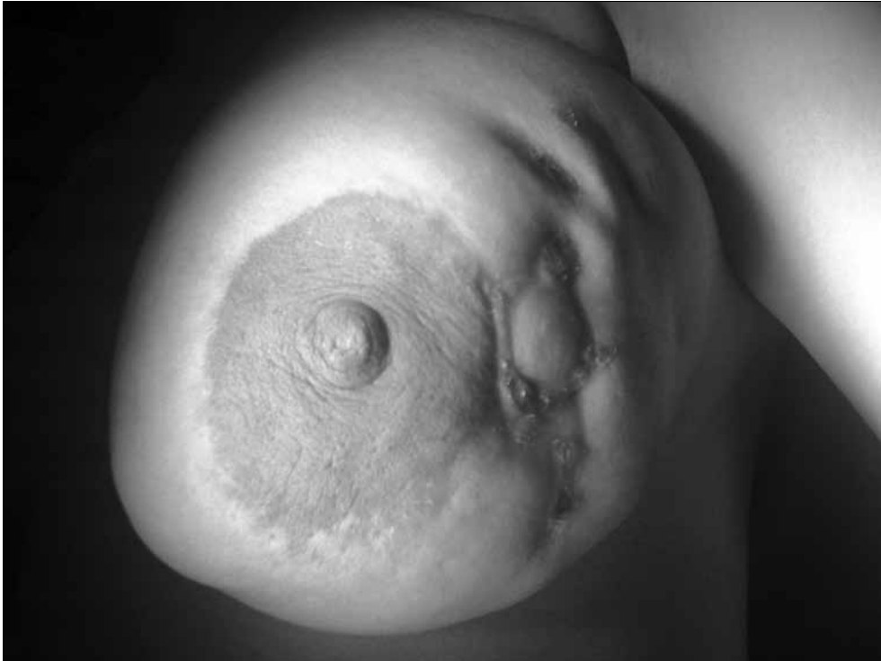
Şekil 1. Sol memede kitle oluşturan ve fistül ağızları gözlenen granülatöz mastit.

Hastaların yaşları 22-52 (ortalama yaş 35) arasında değişmekte idi. Fizik muayenede sert kitle, fistül ağızları ve apseler saptandı (Şekil 1). Tüm hastalar ultrasonografi (USG) ile incelendi. Gerek görüldüğünde Doppler USG, mamografi ve memenin manyetik rezonans grafisi (MR) çekildi. Hastaların hepsinin hikayesinde uzun süreli antibiyotik ve anti enflamatuvar kullanımı mevcuttu. Tüm olgularda tedaviye yanıt alınmadığı gözlemlendi. On olguda sağ meme, 8 olguda sol meme, 1 olguda iki taraflı tutulum mevcuttu. Vakaların %47'sinde görüntüleme bulguları malignite şüphesi içeriyordu. Hastaların hepsine tru-cut biyopsi yapılarak malignite tanısı ekarte edildi. Dört olguya kortikosteroid tedavisi uygulandı. Hastaların sadece birinde tedaviye tam cevap alındı. Bir başka olguda cevap alınsa da nüks etmesi sonucu cerrahiye karar verildi. On dokuz olgudan 18'ine geniş cerrahi eksizyon yapıldı. Negatif cerrahi sınır oluşturacak şekilde tüm enflamatuvar kitleler çıkarıldı (Şekil 2). Bazı olgularda sinüs ve fistüller boyan-