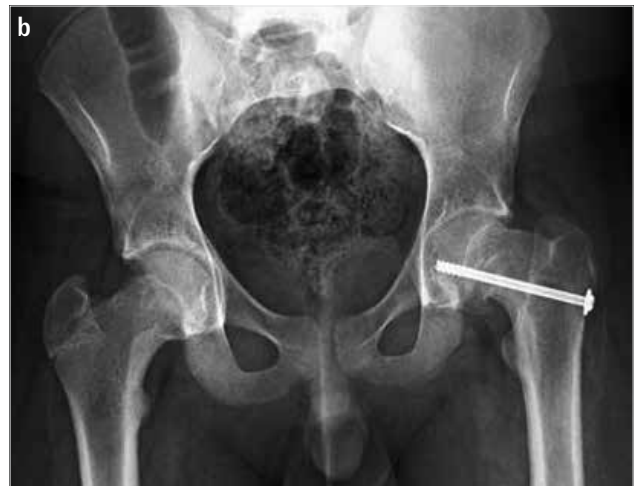
Resim 1. a, b. Tek kanüle vida ile in situ pinleme yapılmış olan 11 yaşında erkek hastanın preoperatif (a) ve postoperatif (b) grafileri