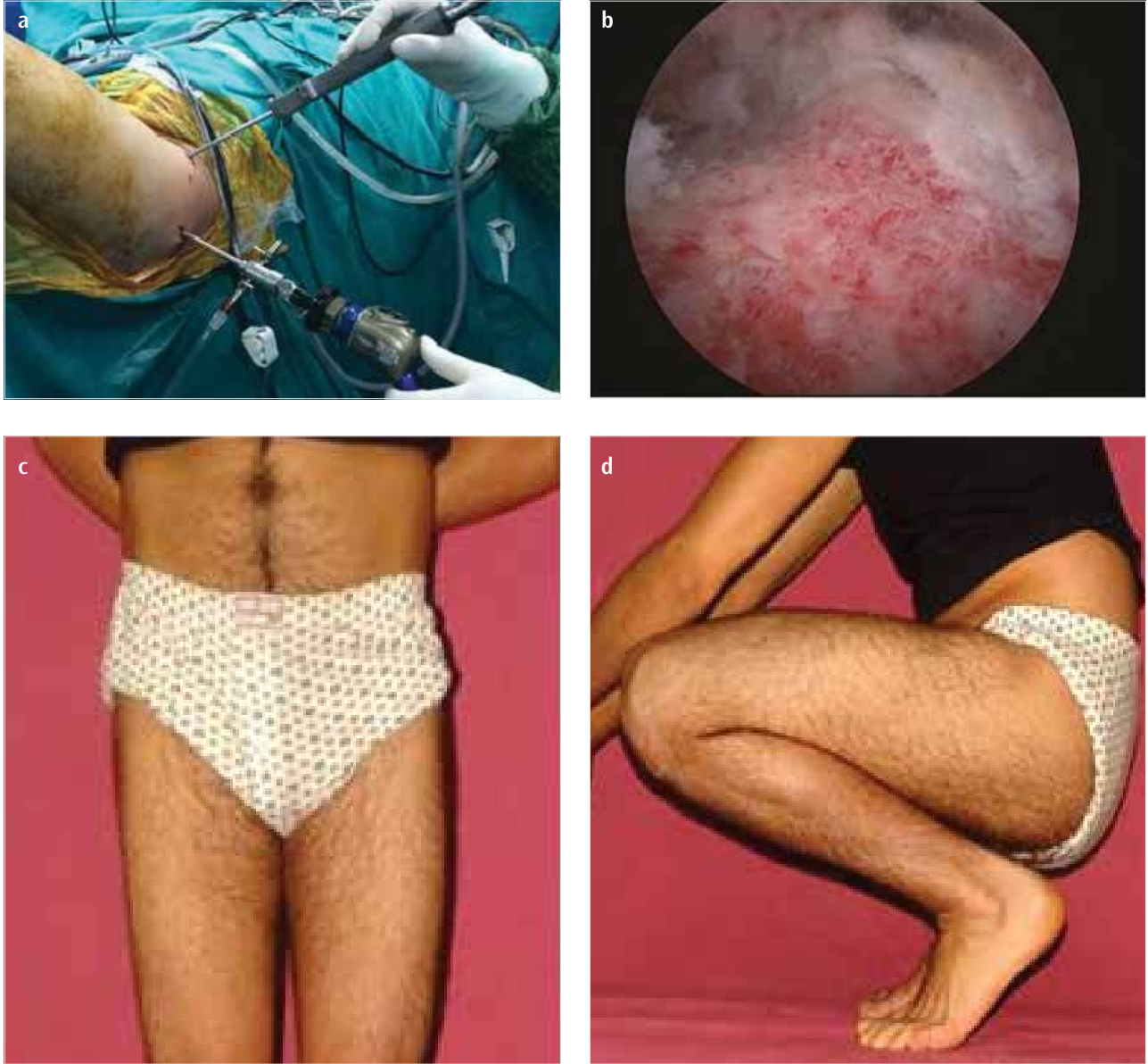
Resim 2. a-d. Hareket kısıtlılığı nedeni ile artroskopik femoroplasti yapılan bir hastanın intraperatif (a, b) ve postoperatif 1. yıldaki klinik görüntüleri(c, d)